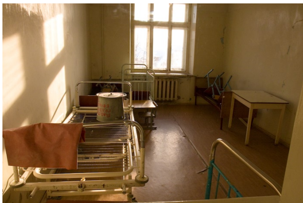
Палата наших отказников во время уборки