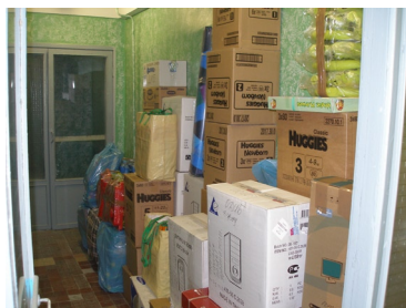
На площадке перед сверхью - видимо, в квартире уже нет места :)