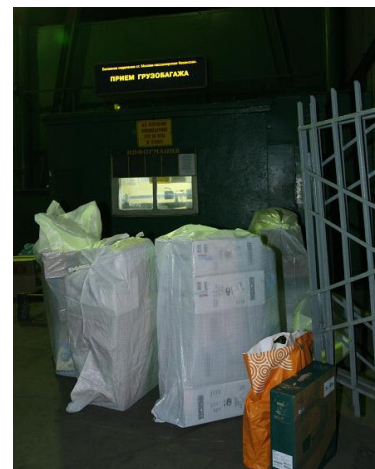
В багажном отделении